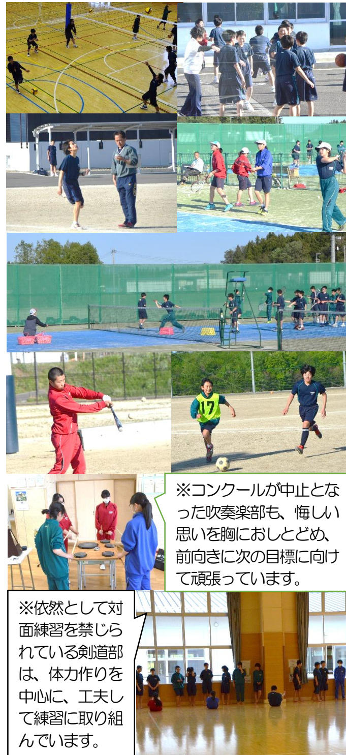
※コンクールが中止となった吹奏楽部も、悔しい思いを胸におしとどめ、前向きに次の目標に向けて頑張っています。